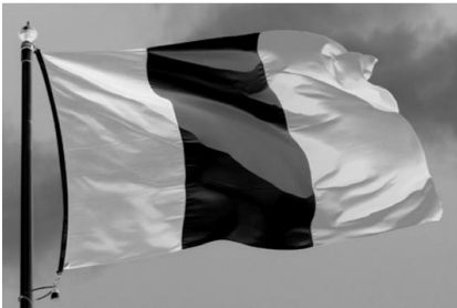
1. Le drapeau français.

1. Regardez les images et nommez-les: (Look at the image and name them)