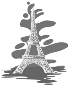
5. La tour Eiffel