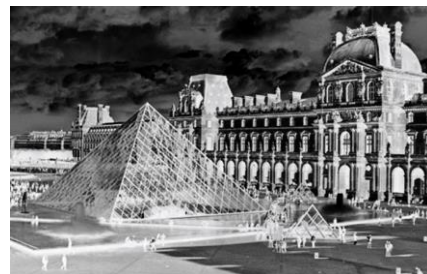
6. Le musée de Louvre

2. Cochez la réponse correcte: (Choose the correct answer)